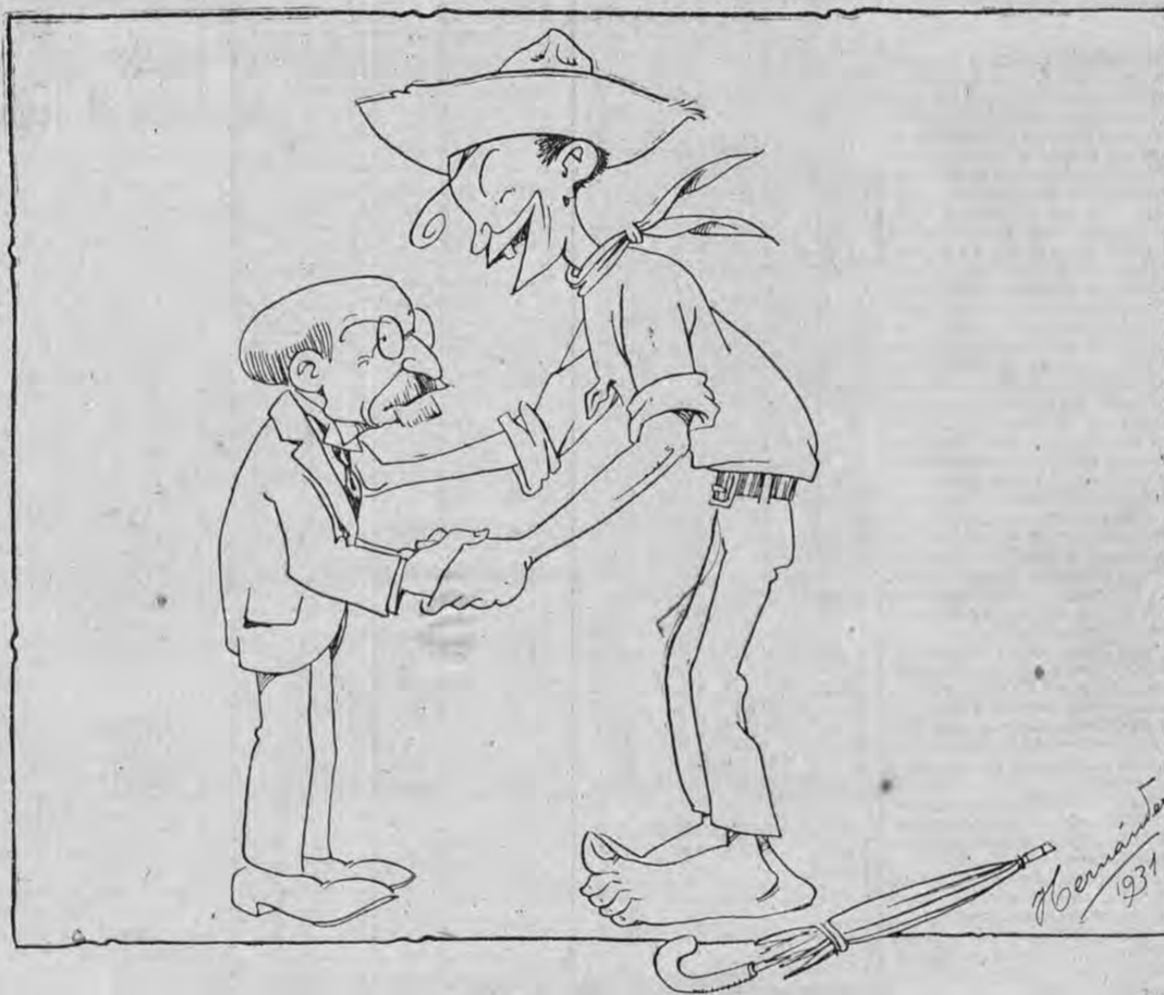
—¡Ahora si viejo! ¡Ya podremos trabajar sin estarnos viendo de reojo!

"Con el nombramiento del ministro de Gobernación ha quedado terminada satisfactoriamente para el país la renovación del gabinete".