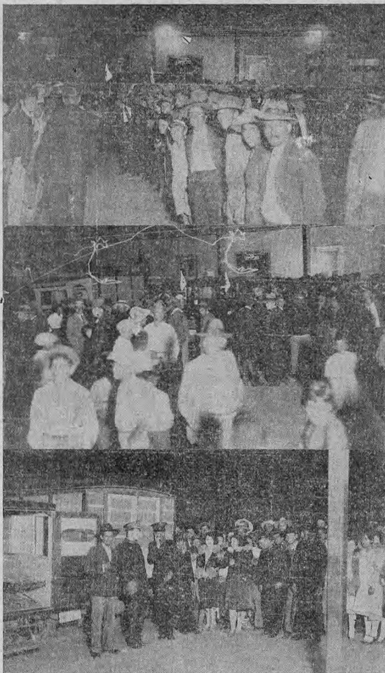
Las fotos ofrecen a nuestros lectores tres aspectos distintos que presentaba anoche la estación del ferrocarril al Pacífico en los momentos en que fueron desembarcados los heridos del choque de trenes ocurrido ayer en Concepción. Por la cantidad de gente podrá verse que este suceso conmovió a buena parte de la ciudad que se agrupó en aquella estación para informarse de los detalles de la catástrofe y para presenciar la llegada de las víctimas.

El señor Soley está empeñado actualmente en el pago de los sueldos de los empleados públicos. Pasa a la página 2